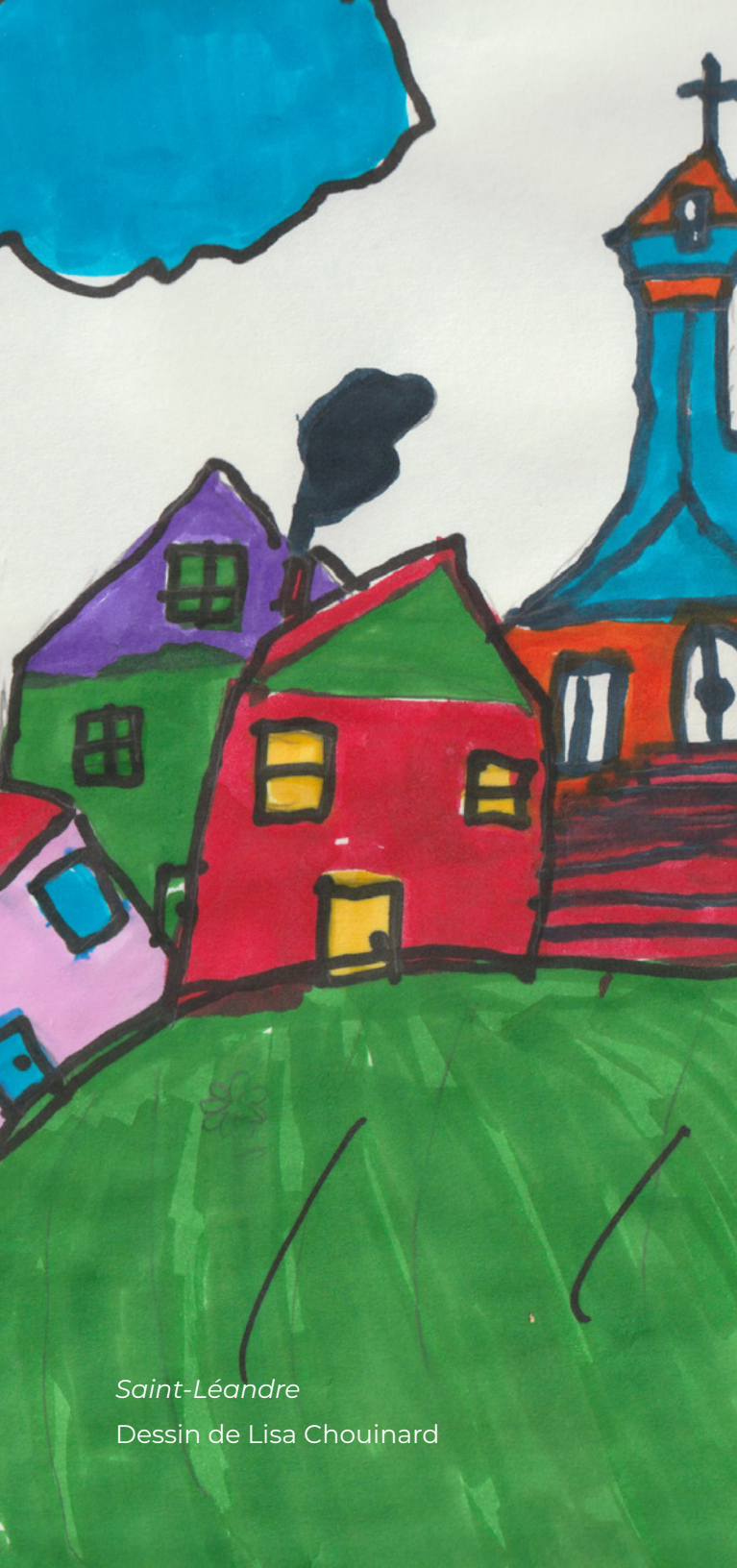
Saint-Léandre Dessin de Lisa Chouinard